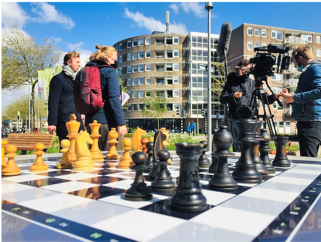
Filmopnames i.o.v. Gemeente Dordrecht bij de Schaaktafel Bieshof, binnenkort op Youtube te zien